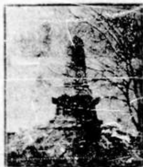
Monumentul eroilor francezi